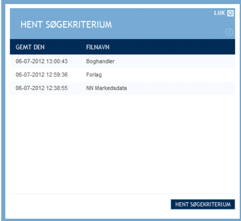
Figur: Vindue med oversigt over gemte søgekriterier

Ved at klikke på "Hent søgekriterium" åbner du et overlay-vindue, hvor alle dine gemte søgekriterier er listet. Udover det angivne filnavn ses også det eksakte tidspunkt, hvor hver enkelt søgekriterium er gemt.