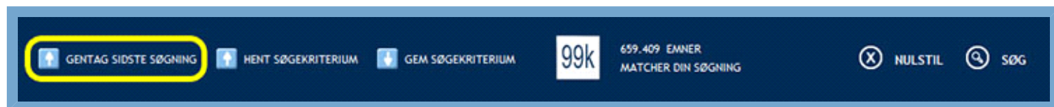
Figur: Knap til at gentage sidste søgning

Bemærk: Denne funktion er kun tilgængelig, hvis du har oprettet en brugerprofil.