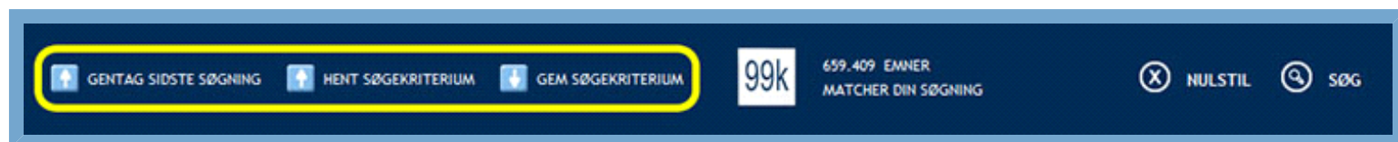
Figur: Knapper til brug ved bearbejdning af søgekriterier

Oversigten over søgeresultaterne beskrives nærmere i vejledningen Søgeresultater .