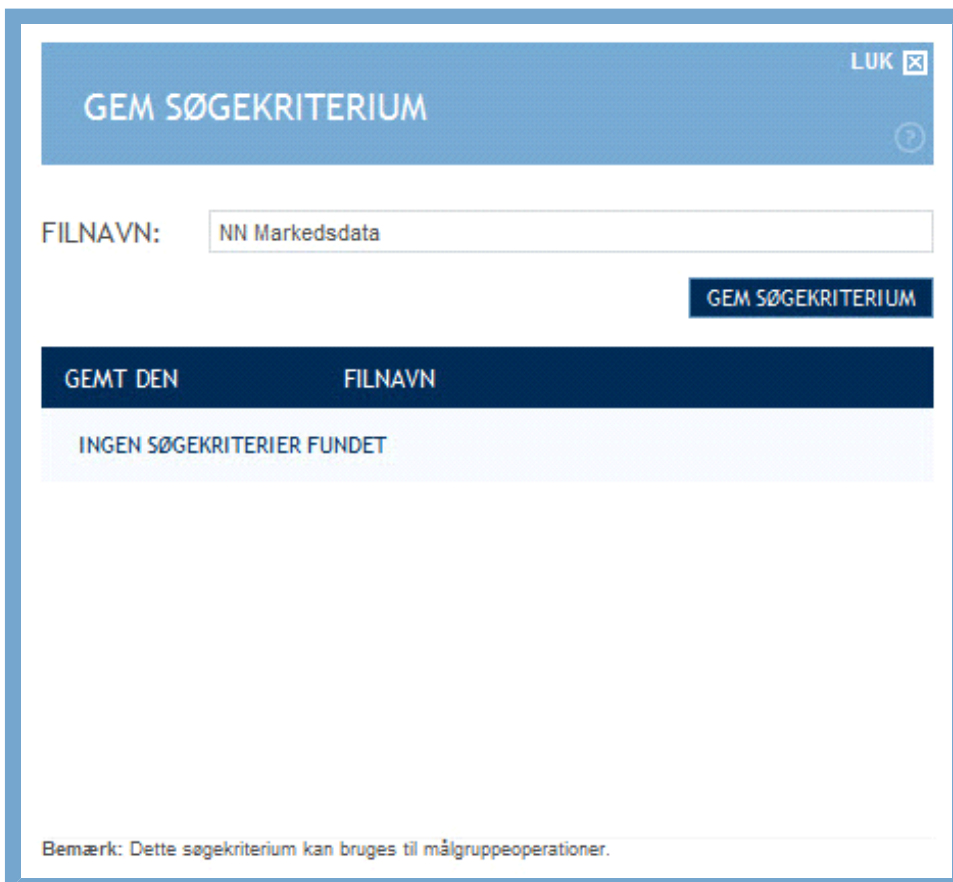
Figur: Vindue for at gemme søgekriterier

Når du har indtastet de ønskede søgeværdier, klikker du på "Gem søgekriterium". Kriteriet udgøres af alle de indtastede værdier. Klikker du på denne knap, åbnes et overlay-vindue med overskriften "Gem søgekriterium".