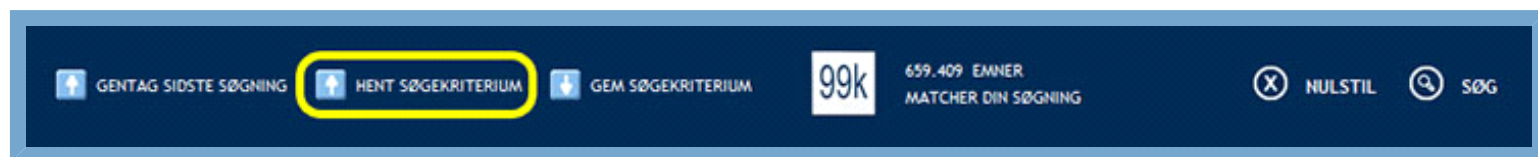
Figur: Knap til at hente gemte søgekriterier

Bemærk: Denne funktion er kun tilgængelig, hvis du har oprettet en brugerprofil.