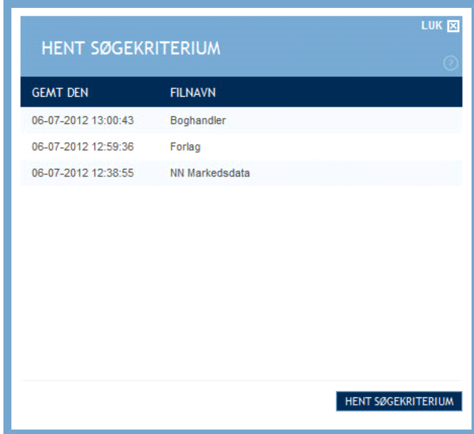
Figur: Vindue med oversigt over gemte søgekriterier

Ved at klikke på "Hent søgekriterium" åbner du et overlay-vindue, hvor alle dine gemte søgekriterier er listet. Udover det angivne filnavn ses også det eksakte tidspunkt, hvor hver enkelt søgekriterium er gemt.