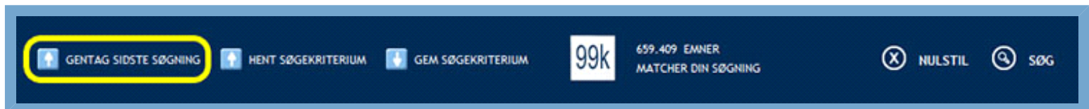
Figur: Knap til at gentage sidste søgning

Bemærk: Denne funktion er kun tilgængelig, hvis du har oprettet en brugerprofil.