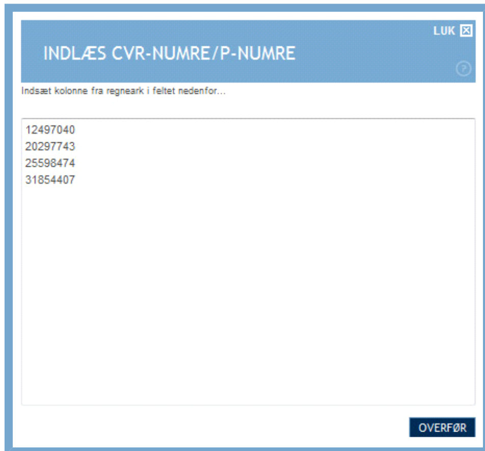
Figur: Vindue til at indlæse CVR- og P-numre

Har du mange CVR-numre og/eller P-numre samlet i et eksternt dokument som fx et regneark, kan du med fordel bruge "indlæs"-funktionen ved at klikke "Indlæs" til venstre for feltet.